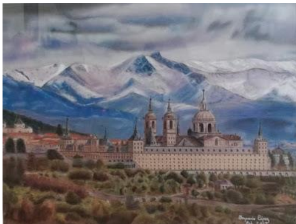
MONASTERIO DE SAN LORENZO DE EL ESCORIAL

Estas eternas hiladas de sillares que encierran sobrios bronces y mármoles, sin dejar de ser austeros, sus infinitos muros seculares.